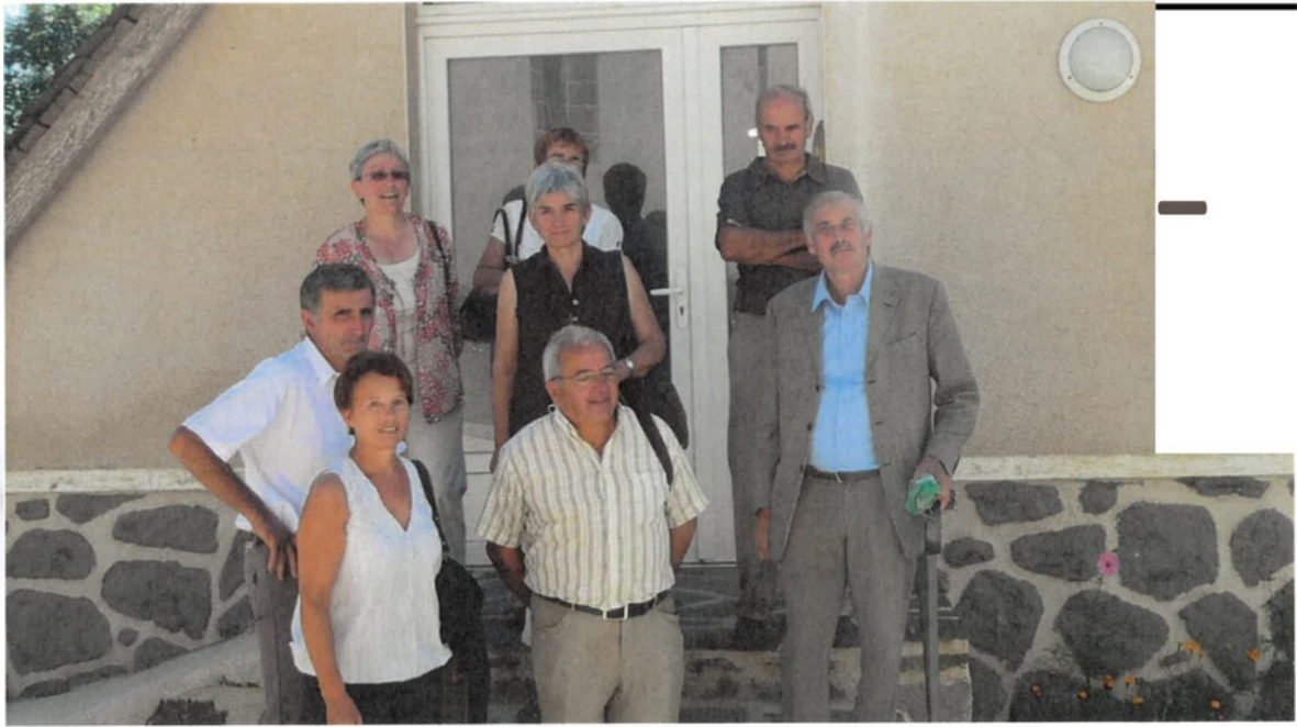
INAUGURATION MAISON ABBE BESSIERE LE 22 AOUT 2010