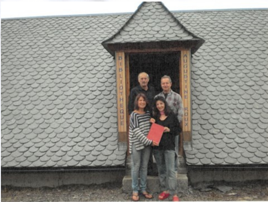
INAUGURATION BIBLIOTHEQUE AUGUSTINE ROUX A VINES EN AOUT 2011